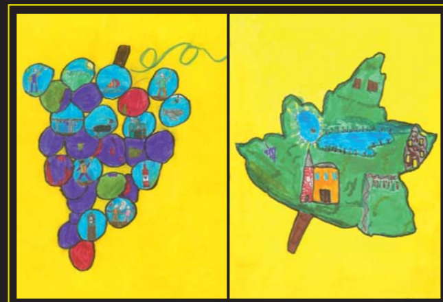
Realizzato dai bambini delle scuole elementari di Roppolo - Viverone

www.lagodiviverone.it - e-mail: info@lagodiviverone.it